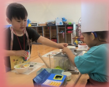
お店屋さんごっこ (幼)