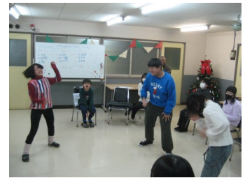
(ウィンターフェスタ)