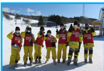
野外活動：ひるがの高原

学校設定科目「社会生活科」で将来の職業生活や社会生活に必要な知識や態度の習得を目指しています。