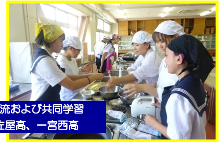
交流および共同学習 佐屋高、一宮西高