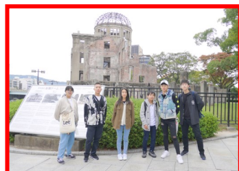
修学旅行：広島・山口方面