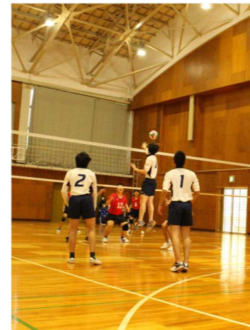
バレーボール大会に参加