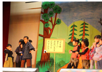
小学部学習発表会