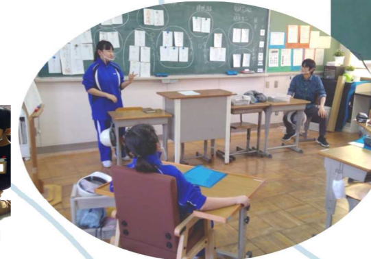
高等部授業（自立活動）