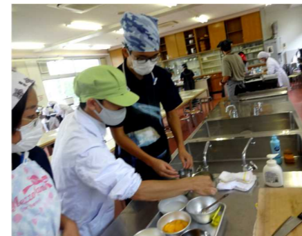
佐屋高校との交流