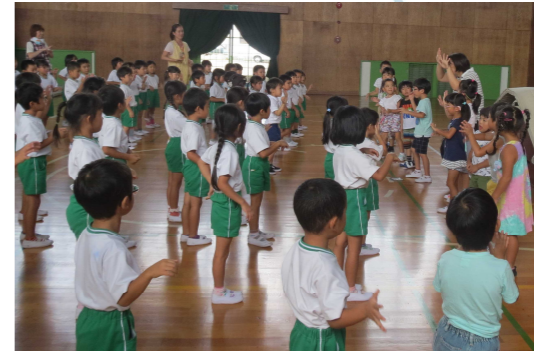
大和保育園との交流